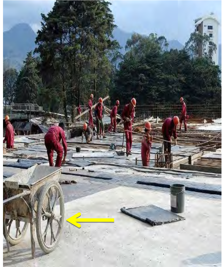
Izq. Trabajadores en las afueras del proyecto privado, llevando carretillo. Der. Carretillo utilizado en construcción del Estadio Nacional