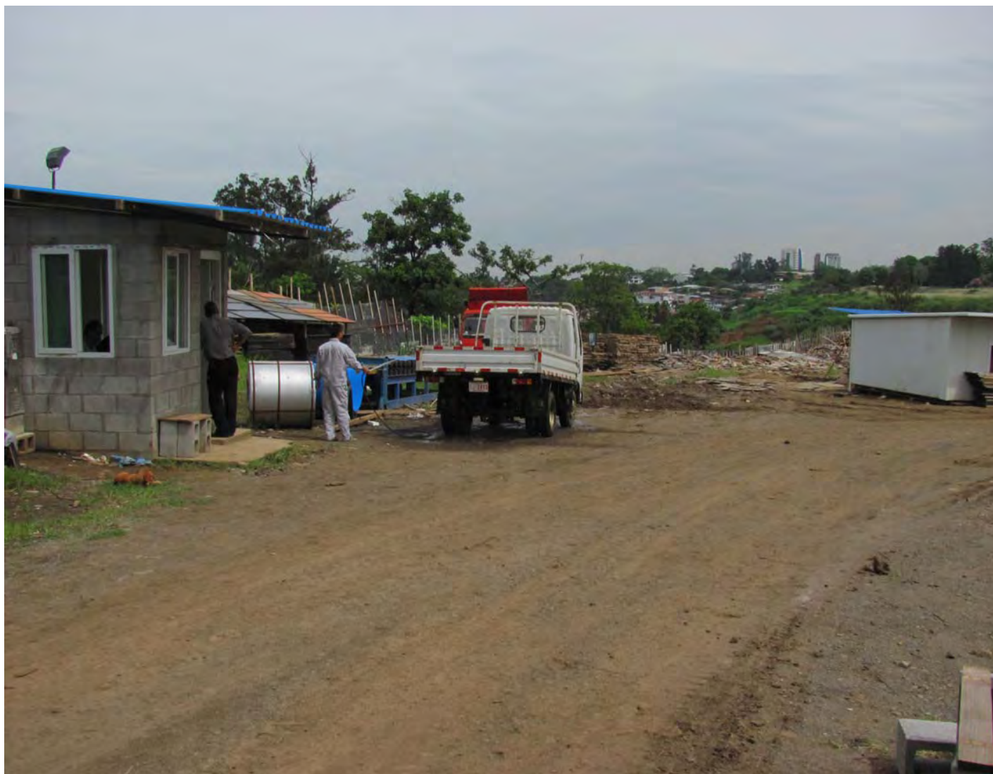
Plantel de depósito de materiales del Estadio Nacional.